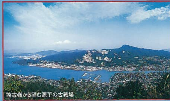
談古嶺から望む源平の古戦場