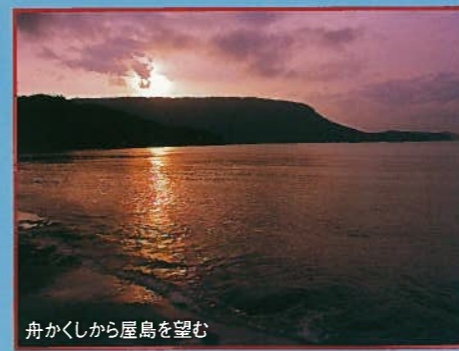
舟かくしから屋島を望む