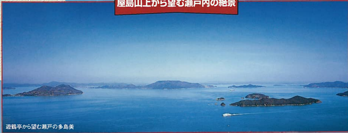
遊鶴亭から望む瀬戸の多島美