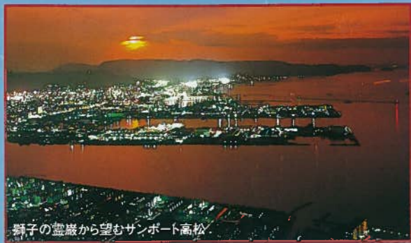
獅子の霊巖から望むサンポート高松